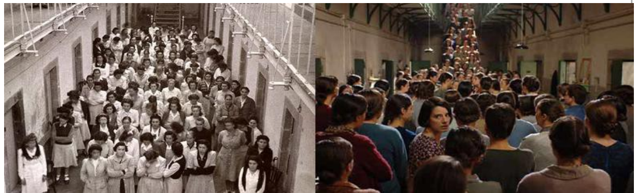
Las trece rosas Carlos Fonseca / Emilio Martínez